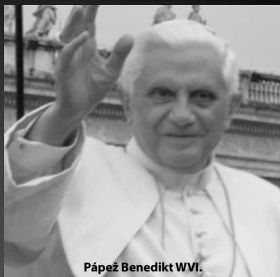
Pápež Benedikt XVI.