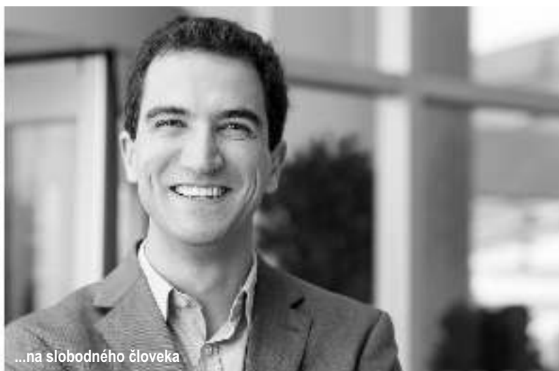
...na slobodného človeka