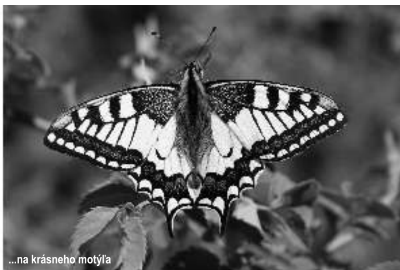
...na krásneho motýľa