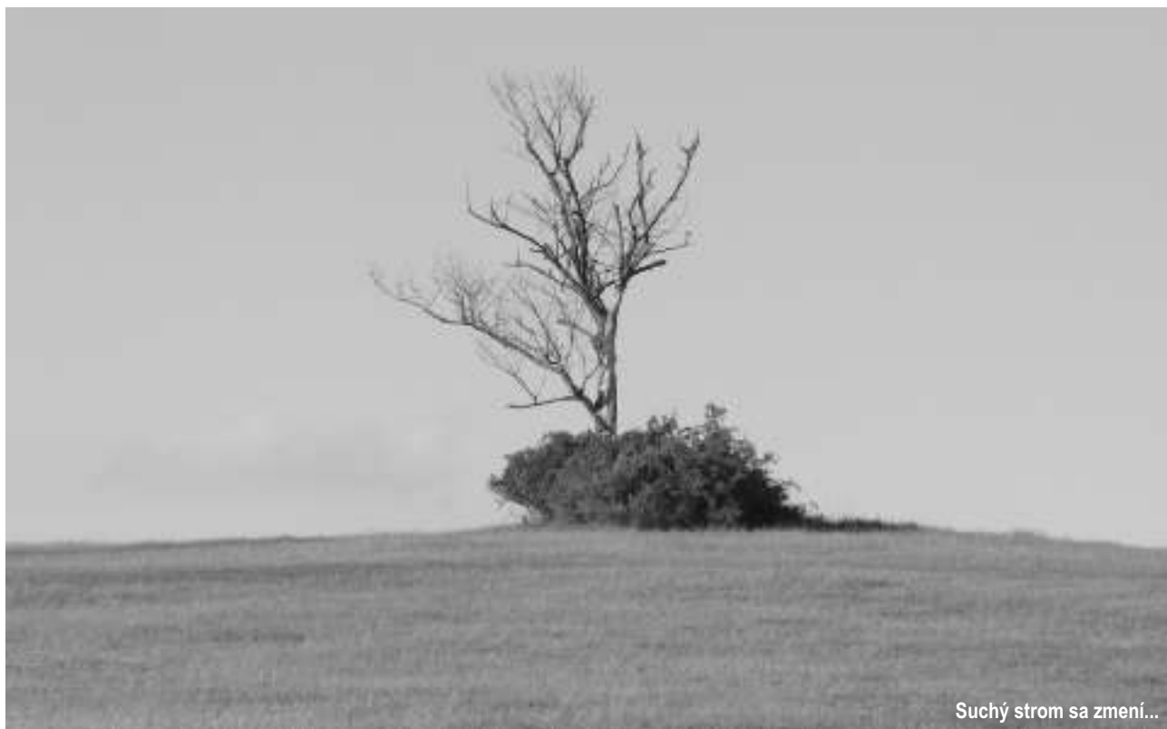
Suchý strom sa zmení...

Bože, nevzdialuj sa odo mňa! Môj Bože, ponáhľaj sa mi na pomoc!" Žalm 71.10