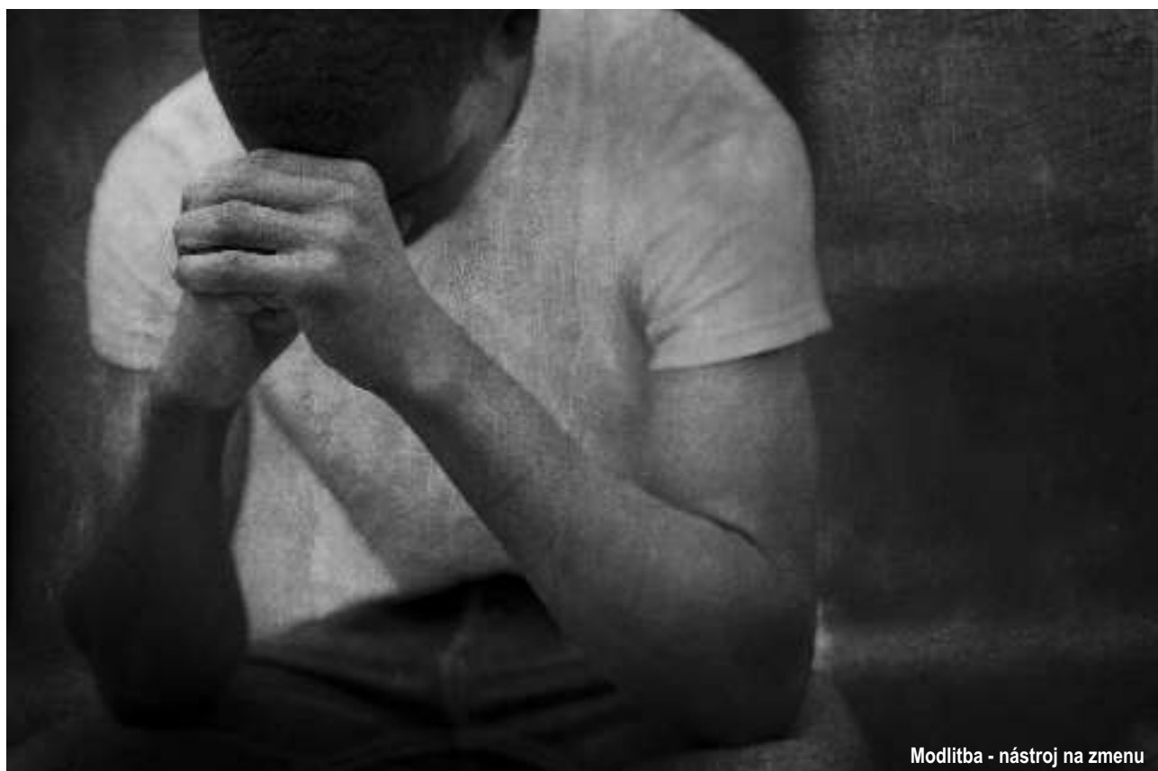
Modlitba - nástroj na zmenu

neho poslal túto chorobu. Skonštatoval, že je to jeho nemoc a hľadal zmenu.