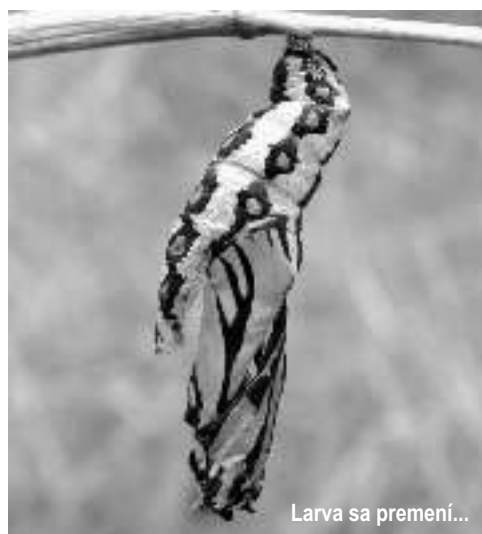
Larva sa premení...

Napríklad Dávid. Našiel sa v strašne úbohom stave, rozpoložení. Hovorí o tom Žalm 77. Ale Dávid si nemyslel, že to je jeho koniec, že sa to nemôže zmeniť. Tiež si nemyslel, že Boh na