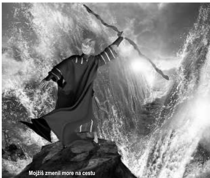
Mojžiš zmenil more na cestu

Napriek tomu vidíme v našich životoch zlyhania, pády a slabosti, ktoré nás ničia, otravujú, znechucujú a berú nám silu. Nedaj sa oklamať satanovou propagandou. Boh je Bohom nádeje a každého potešenia a nie Bohom