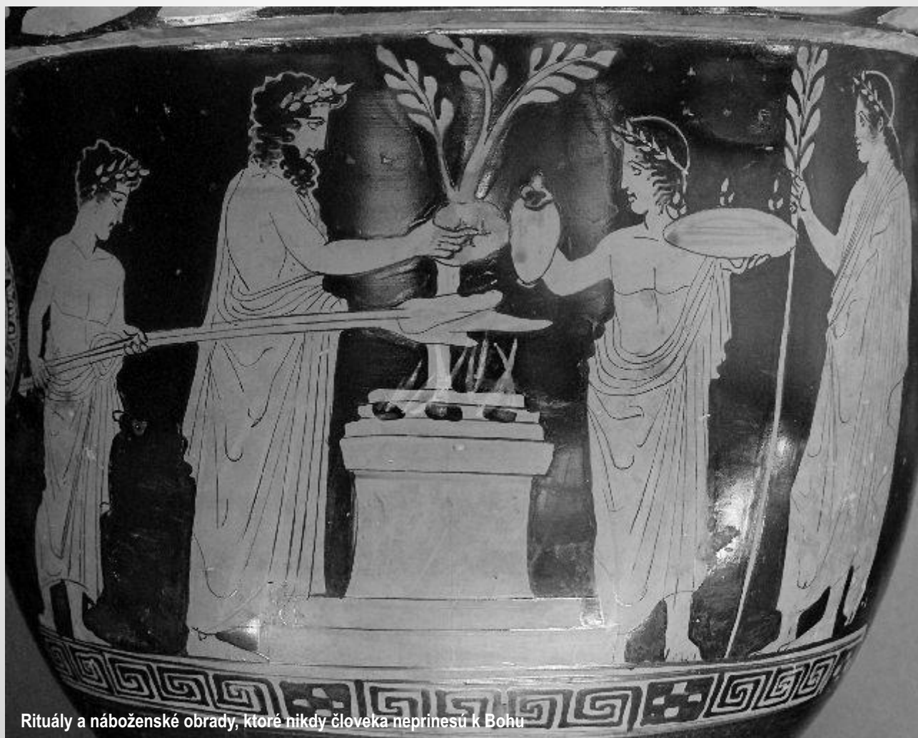
Rituály a náboženské obrady, ktoré nikdy človeka neprinesú k Bohu

Viera mu priniesla ospravednenie u Boha. Viera ho viedla do konania, do donesenia obete a priniesla mu