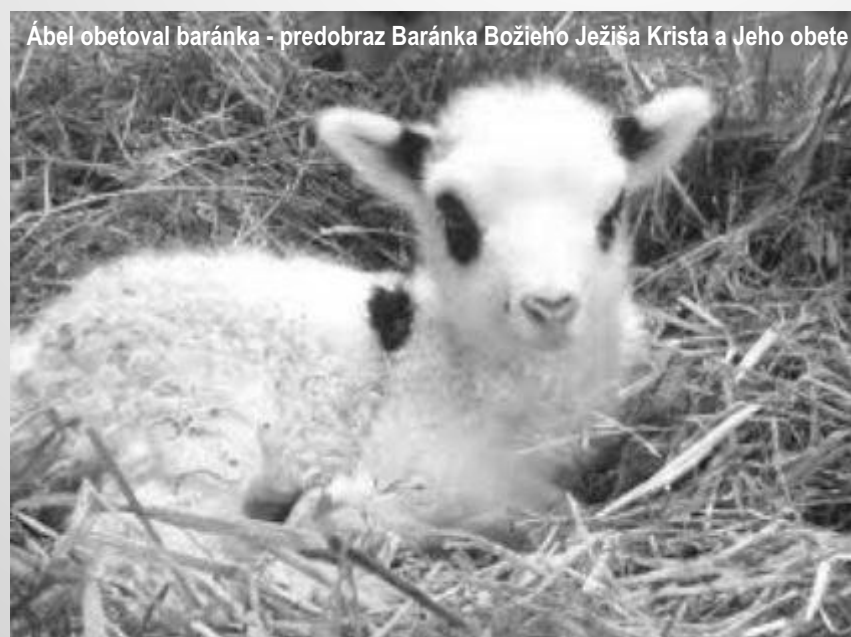
Ábel obetoval baránka - predobraz Baránka Božieho Ježiša Krista a Jeho obeť