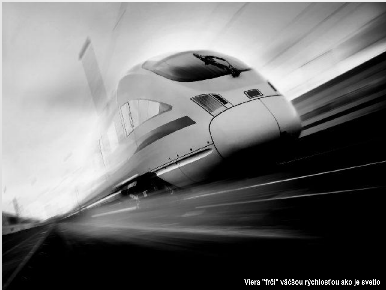
Viera "frčí" väčšou rýchlosťou ako je svetlo

Veď Boh sa postaral o to, aby každý vedel o tom, že Ábel priniesol obeť- a Boh to pripomína ešte dnes tisícky rokov potom, čo sa to stalo, že Ábel doniesol obeť, nikoho nenecháva na pochybách, ale zdôrazňuje, že to urobil VIEROU, nie svojou silou, mocou.