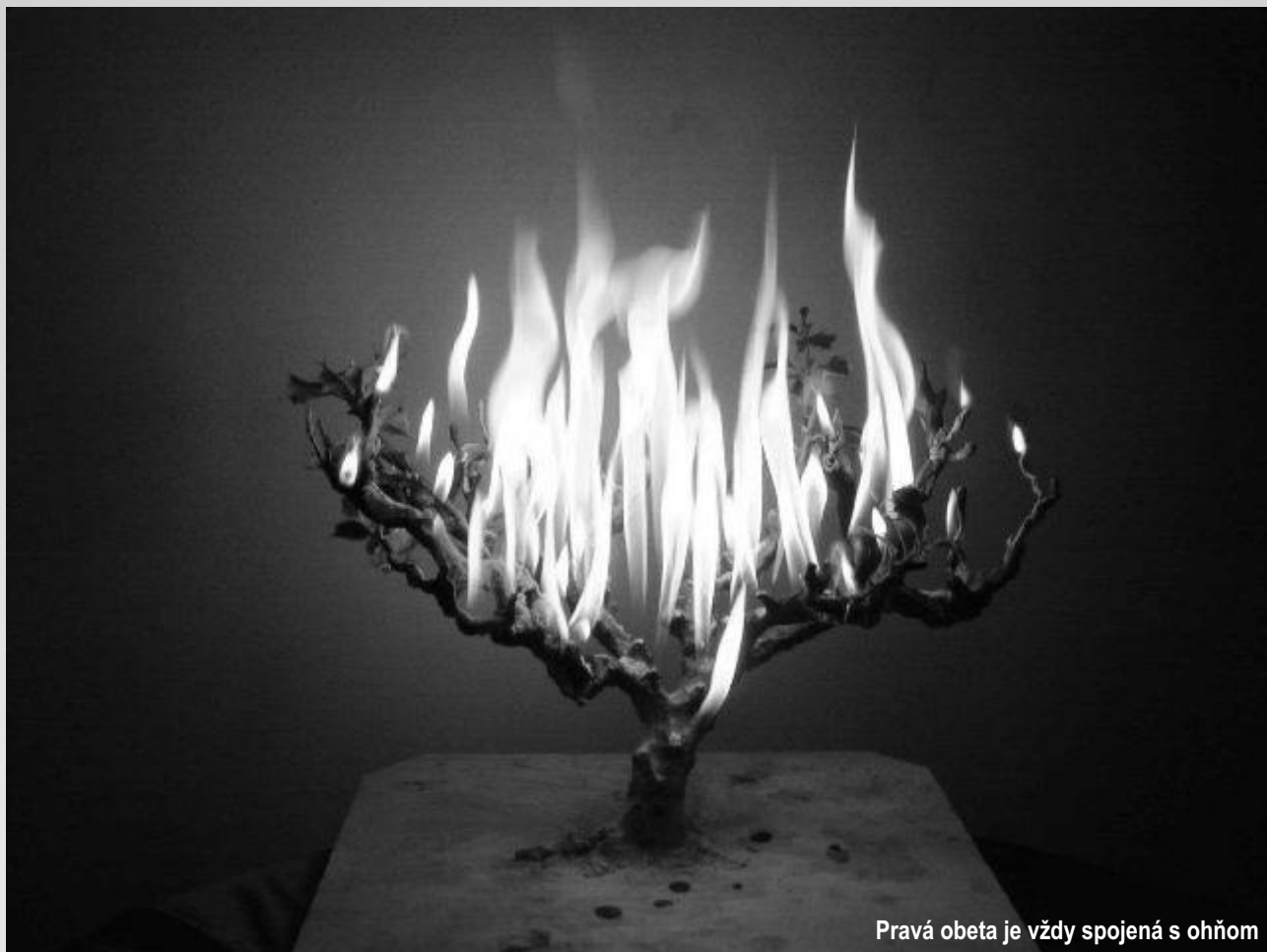
Pravá obeta je vždy spojená s ohňom