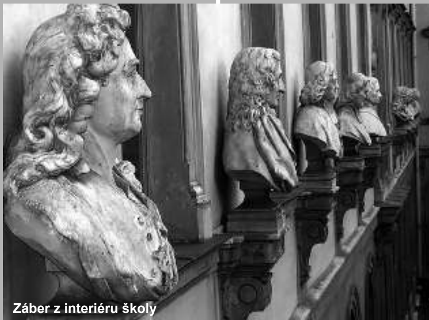
Záber z interiéru školy

Pasteur národným hrdinom a nositeľom mnohých domácich i zahraničných počt. Francúzsky štát mu nepoďakoval len doživotnou rentou, ale na počtu zriadil „Pasteurov inštitút“ ako výskumné stredisko, v ktorom bol Pasteur až do svojej smrti riaditeľom. Z lekárskej fakulty v Bonne obdržal „úctívny diplom doktora“, ktorý však s veľkým protestom počas nemecko-francúzskej vojny poslal naspäť. Na jeho hrobke sú vyryté názvy jeho objavov, ale v jeho srdci a nad jeho životom boli vyryté slová, ktoré aj dnes znejú a volajú na všetkých ľudí, poukazujúc na to, kto a čo stálo za jeho objavmi a mimoriadne plodným vedeckým životom.