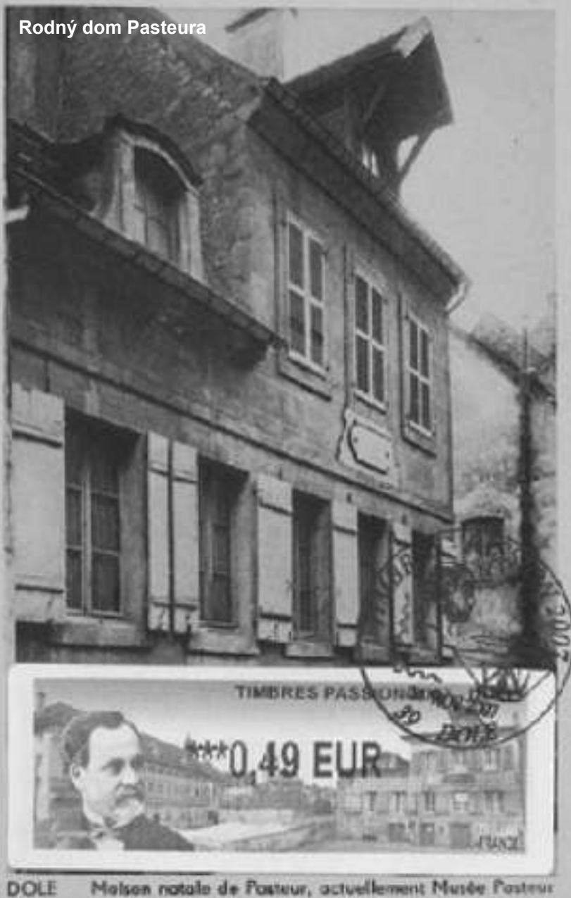
Rodný dom Pasteura

a imunológie a stal sa najväčším dobrodincom a najväčším biológom svojho času.