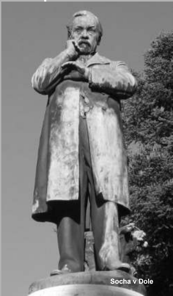
Socha v Dole

Na celom tom objave ho najviac fascinovala zložitá štruktúra malých kryštálikov, na ktoré pozeral ako na priame dôkazy umeleckého vyjadrenie sa Boha v zložitých kryštalických štruktúrach. Jednoducho, Boha neopúšťal ani pri práci v laboratóriách, naopak,