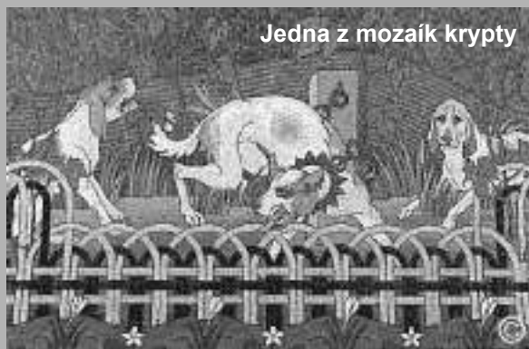
Jedna z mozaík krypty

aby bolo, jako je napísané: Ten, kto sa chváli, nech sa chváli