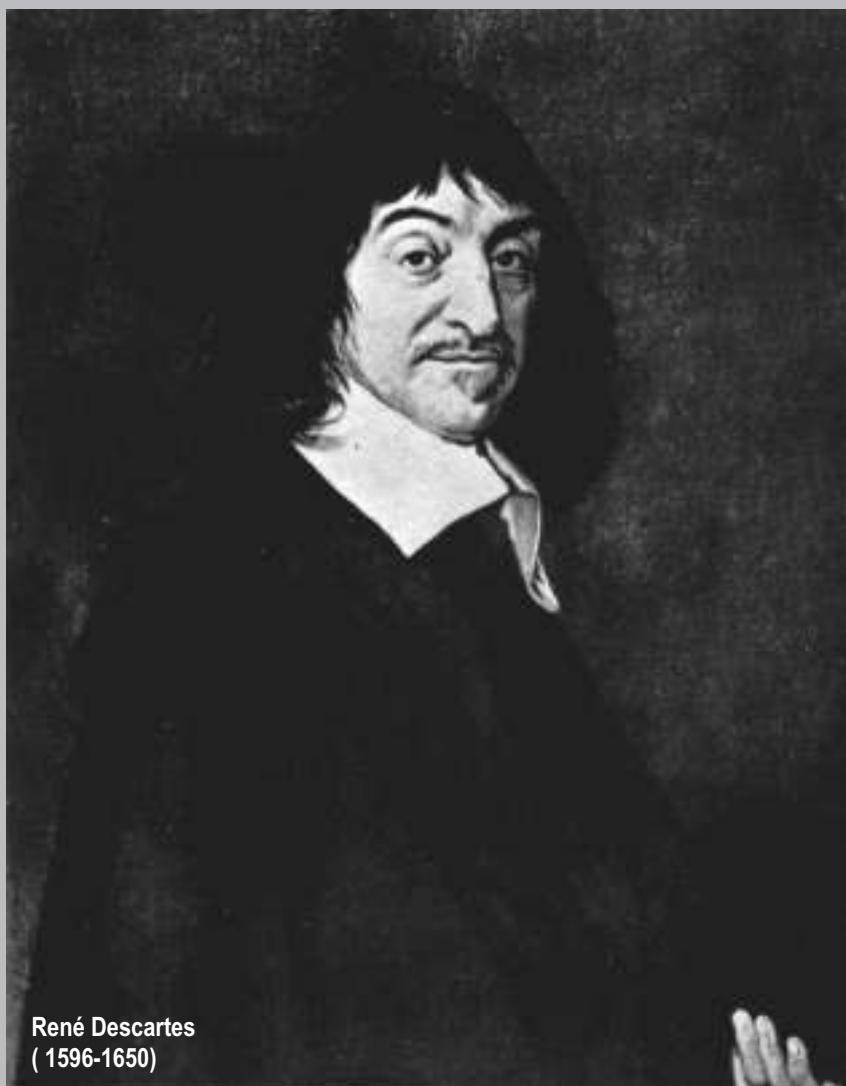
René Descartes (1596-1650)

Dejiny nám ponúkajú množstvo významných osobností, ktoré sa hrdo hlásili ku kresťanskej viere.