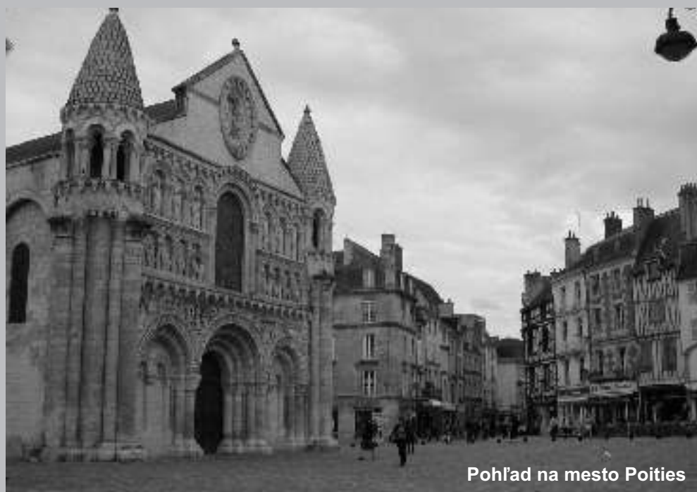
Pohľad na mesto Poities

Descartes tvrdil, že on bráni kresťanskú vieru, ktorá sa ocitla vo svete skôr vedeckom a racionálnom.